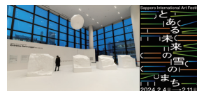
参考画像: さっぽろウィンターチェンジ2021 「Extreme Data Logger: 都市と自然の記憶」

雪国の都市機能である除雪や排雪について独自の研究をしてきたSIAFラボと、雪まつり会場で「未来の雪のまち」の実証実験を行うクリエイティブチーム・パノラマティクスによるコラボレーション展を通じて、北国の都市と自然について考えます。